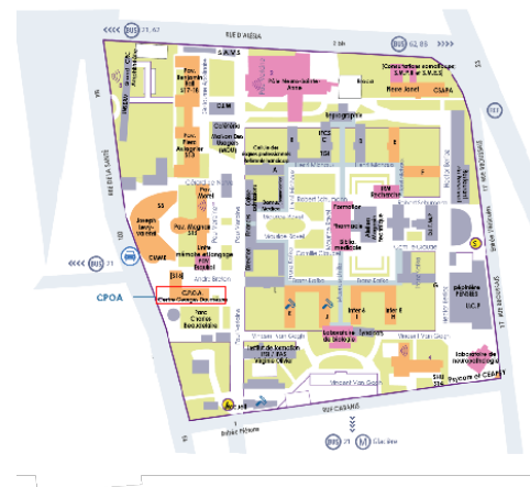
PLAN SITE SAINTE-ANNE